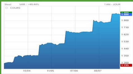
Cours mondial de l'acier 18.08.21 (cliquer)

Les matières premières sont en hausse depuis de nombreux mois. Le prix de l'acier a presque doublé (voir schéma et lien associé). Les conséquences sont graves pour les éoliens, fabricants ou promoteurs. L'équilibre, déjà fragile, de leurs business plans est remis en question. Ecouter cette émission de la RTS à la minute 8'35''