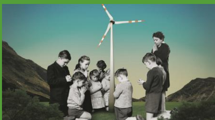
Première illustration de l'article du 10.08.21

Le Temps a encore le courage de publier des caricatures. L'image ci-dessus était donc destinée à illustrer un article de l'Abbé François-Xavier Amherdt intitulé « Pour une spiritualité intégrale : dix appels ». Les réactions ne se sont pas fait attendre et l'image a disparu deux jours après.