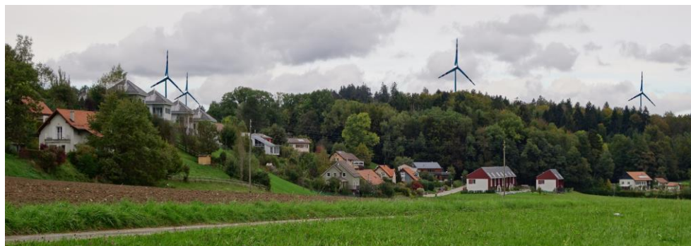
EolJorat Sud depuis Vers-Chez-Les-Blanc

L'association Eole Responsable lutte contre la zone industrielle EolJorat Sud, dont les éoliennes vont affecter le parc naturel périurbain le plus apprécié des Lausannois, le Jorat, et les milliers d'habitants qui vivent aux alentours.