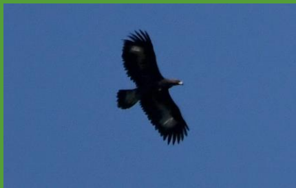
Artémis, l'aiglon né en 2020

Les aigles royaux ont été exterminés à la fin du 18ème siècle. Depuis 2 ans, un couple d'aigles royaux s'est établi sur les hauteurs du Val-de-Travers. En 2020, ils ont donné naissance à un aiglon : Artémis. Surpris par cette nouvelle qui devrait réjouir les amoureux de la nature, les promoteurs se veulent rassurants mais ne rassurent personne : « les aigles ne vont pas voler près des éoliennes et resteront à distance ». Voir l'article RJB .