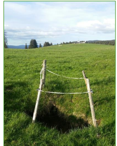
Trou No 1 formé aux Grands Plats, mai 2021