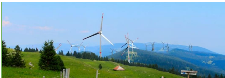
Vue sur les parcs de Grandsonnaz et Provence depuis le Chasseron

En amont des mises à l'enquêtes de Grandsonnaz et Provence, nous entreprenons plusieurs démarches d'envoi de tous-ménages et multiplions les présentations publiques et privées dans les communes porteuses, afin de sensibiliser la population locale. En 2019, un film 2D/3D a été réalisé et prochainement, notre site internet www.volauvent.ch/ sera mis à jour.