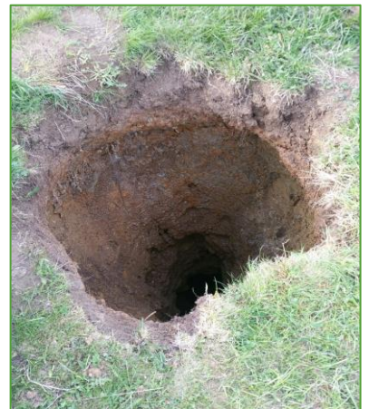
Trou No 2 formé aux Grands Plats, mai 2021 Ø 1m, profondeur 8 m, sur une chambre de ~8m2