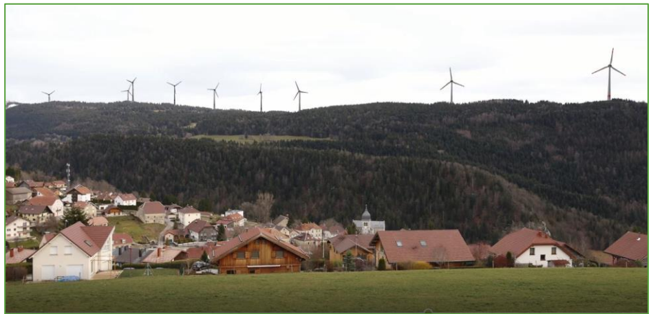
Les éoliennes de Bel Coster depuis Jougne

L'affaire Bel Coster est encore devant la CDAP du Tribunal cantonal et l'on peut dire que ça ferraille fort du côté des opposants (SOS Jura et ONG).