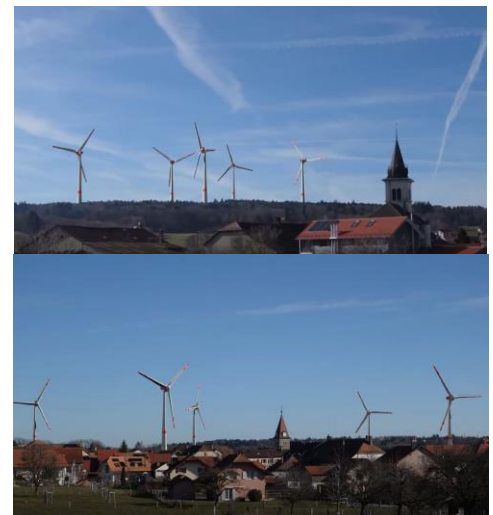
Photos du film : en haut, projet EssairVent depuis St-Oyens, en bas, projet de Bière depuis Bière